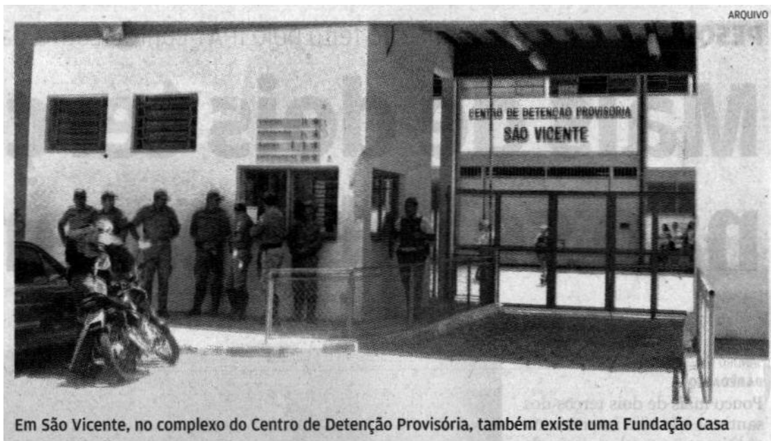
Em São Vicente, no complexo do Centro de Detenção Provisória, também existe uma Fundação Casa