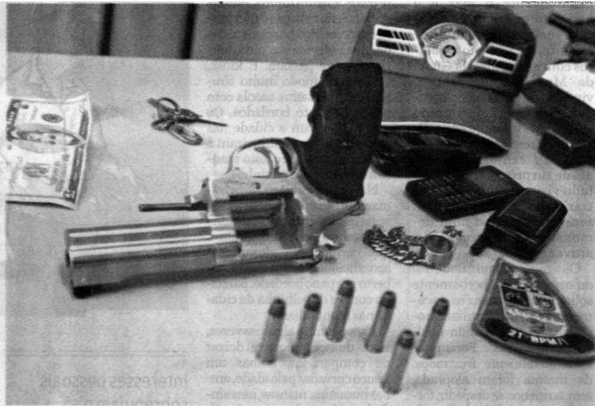
Polícia apresentou ontem a arma e os celulares encontrados em poder dos três homens detidos